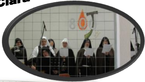
Mosteiro de Santa Clara de Deus Trino Brazlândia/DF