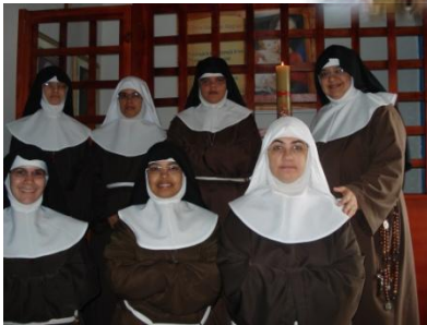
Mosteiro Nossa Senhora das Alegrias Araputanga - MT